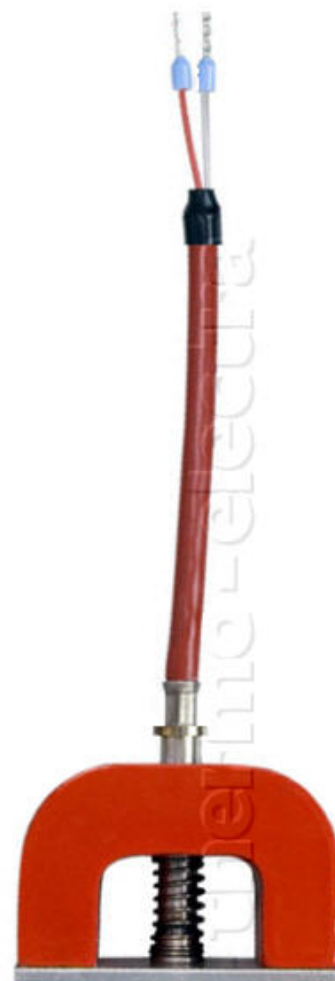
Tolerances for 100 \Omega thermometers