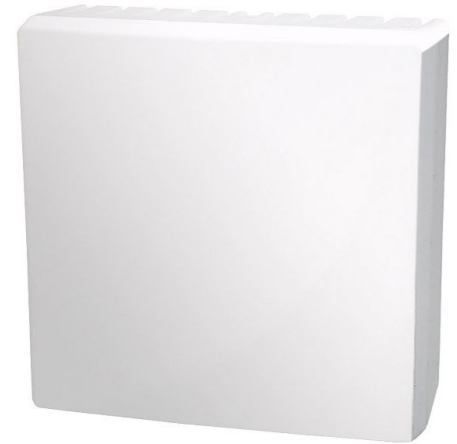
Tolerances for 100 Ω thermometers